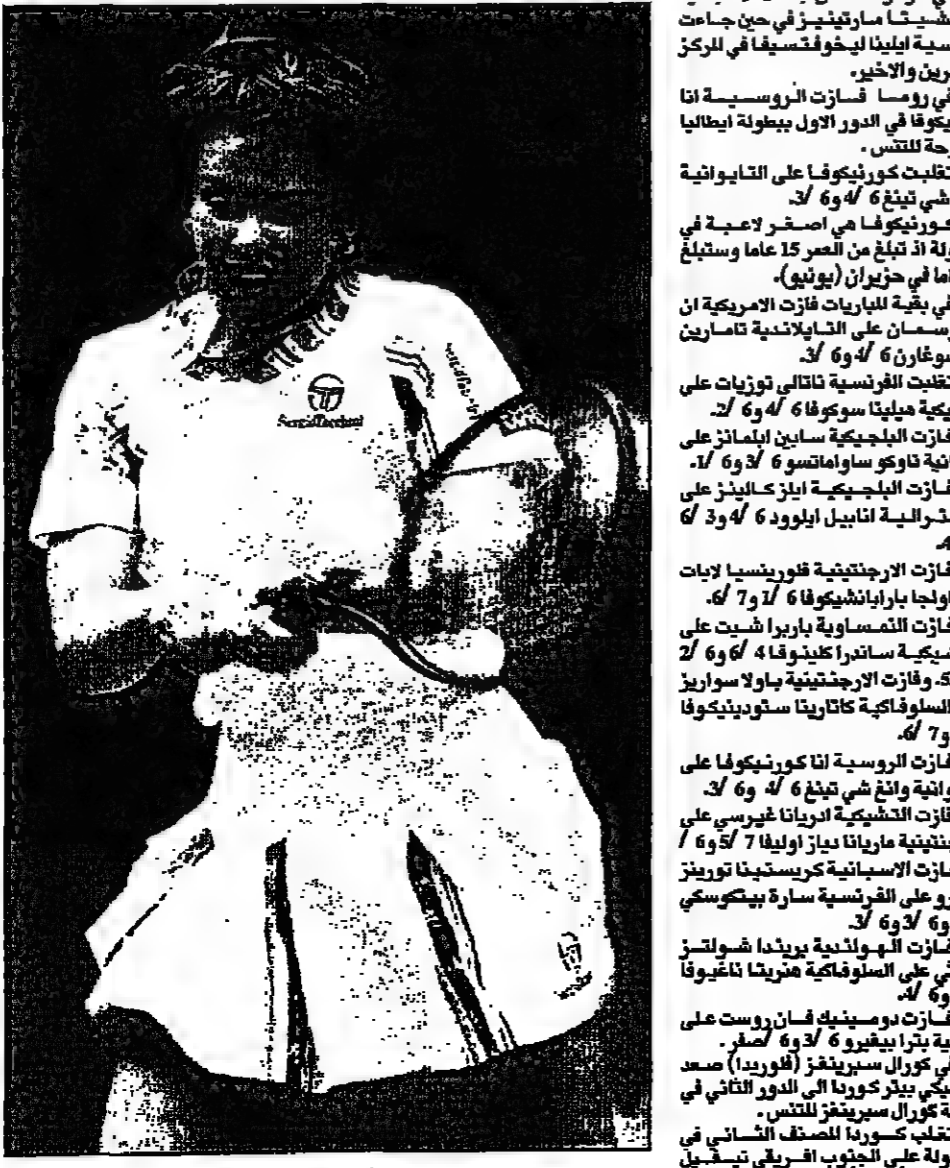
ستيفي غراف لاعبة تنس

سانت بيترسبرغ (فلوريدا) - رويترز: تصدرت الامريكانيه ستيف هينغيس قائمة ترتيب لاعبات التنس العالمية لعام 1996.